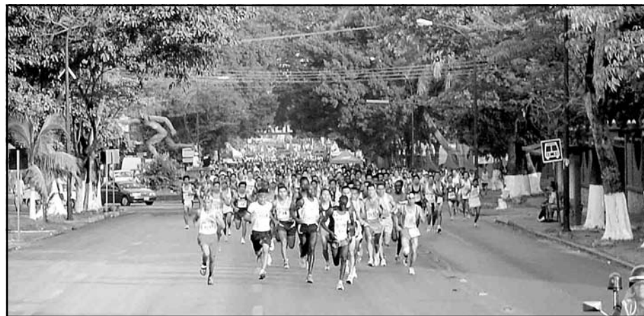
Las fechas en septiembre.

● Se realizarán en tres líneas de acción