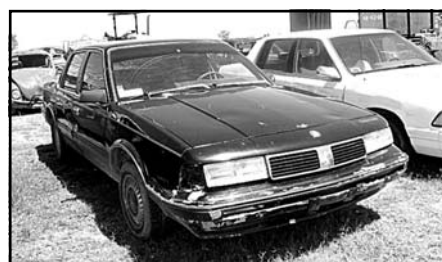
En esta unidad cometían sus fechorías.