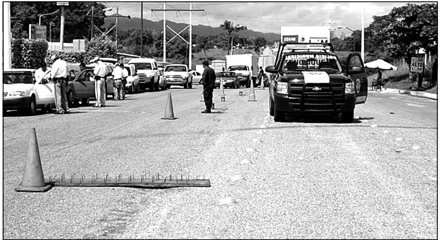
Retén preventivo en la carretera Tenosique-Emiliano Zapata.

Los encargados de la revisión informaron que durante este día no habían detectado ninguna anomalía entre los ve-